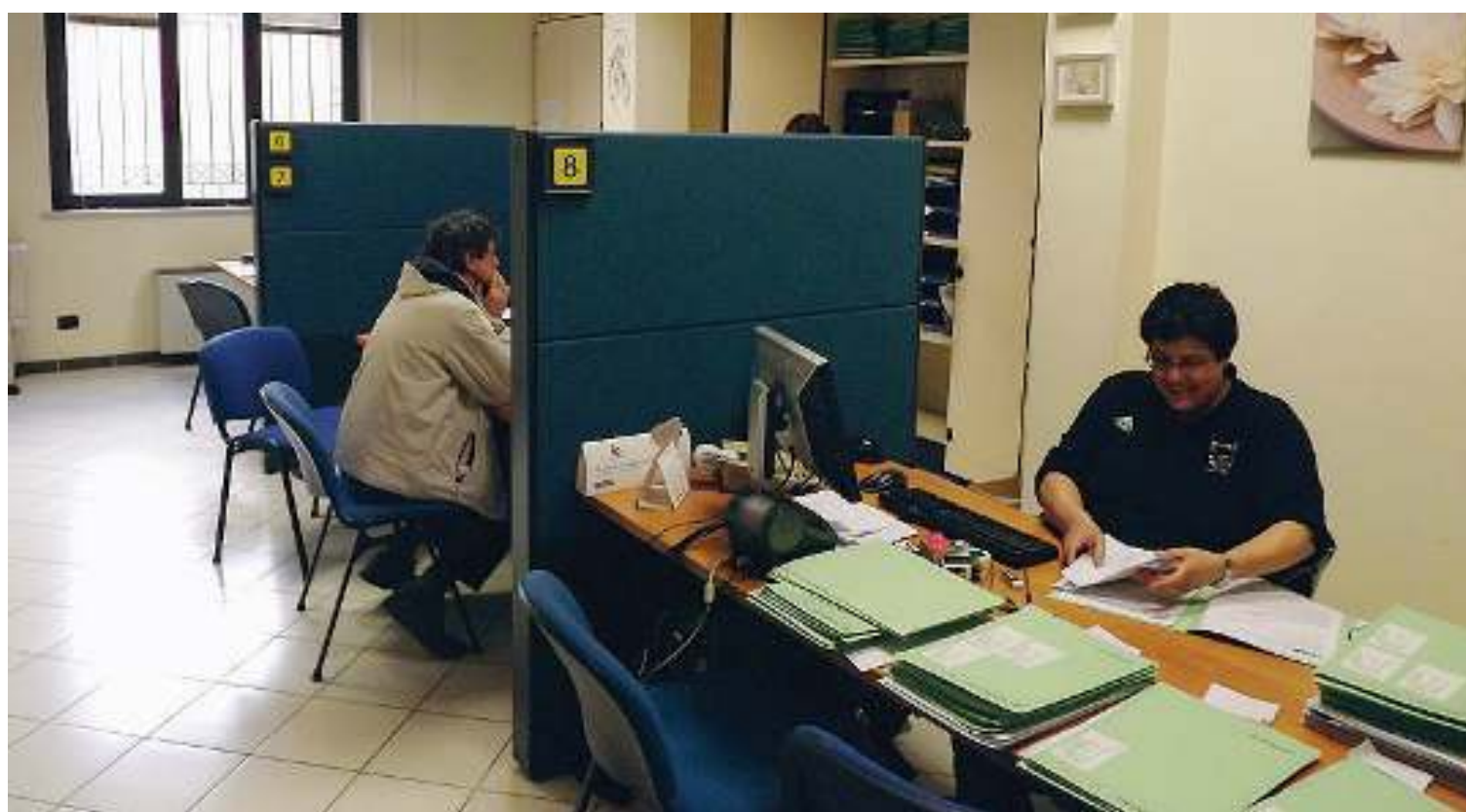
Negli uffici delle Acli bresciane i lavoratori possono trovare un aiuto per tutte le loro esigenze

«Attraversiamo una fase di grande fragilità del mondo del lavoro, sia dal punto di vista materiale che dal punto di vista immateriale. Stare vicino ai lavoratori in questo momento è un compito ancora più importante».